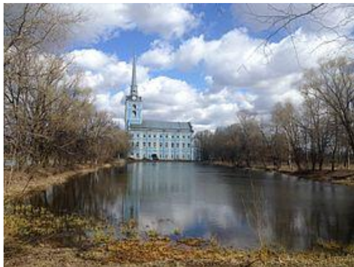
Петропавловский парк Ярославля

И надо стремиться пропагандировать не только уже заявившие о себе на весь мир памятные места города – Стрелку, Волжскую набережную, ярославские музеи, но и открывать ещё неизвестные или малоизвестные, прежде всего, самим ярославцам старинные уголки нашей земли. Это и Перекоп – историческая территория Красноперекопского района,