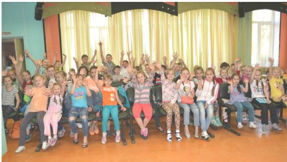
Открытие лагерной смены – 2016 приветствуем!

Но прежде чем знакомиться с другими странами, ребята должны освоить культуру и традиции русского народа. Мы, россияне, живём в России и не знаем свои обычаи, забыли многие социальные