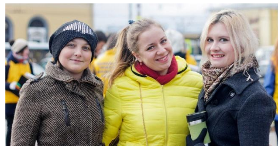
Команда педагогов – «Ярославич»