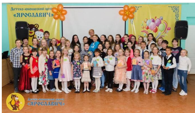
Образцовая Вокально-эстрадная студия «Каприз»

«Капризули» не забывайте о клятве, которую дали! Будьте вместе, будьте рядом всегда и все победы у вас в кармане.