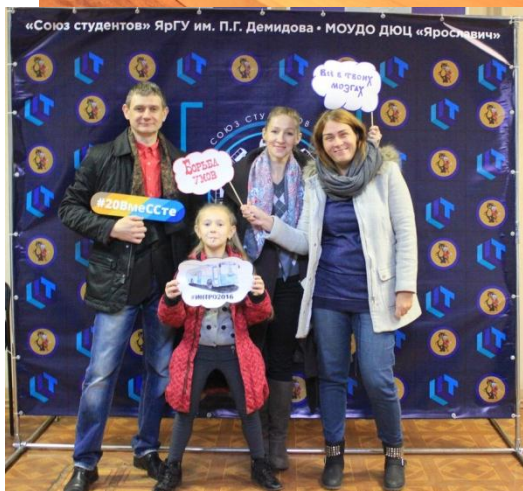
Команда родителей – «Я люблю Ярославич»