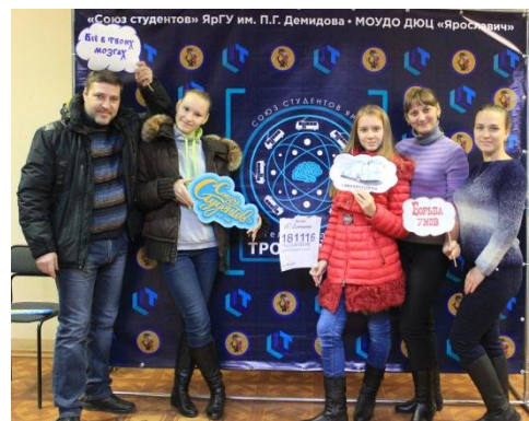
Команда родителей – «Ключик Золотой»