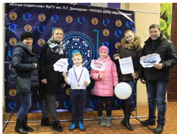
Команда родителей – «Big Brain»