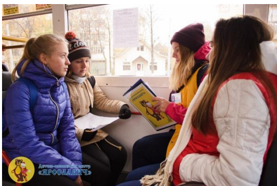
Команда объединения «Забава»