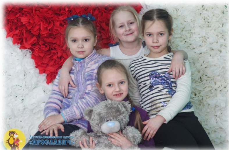
Хореографический ансамбль «Ритм»