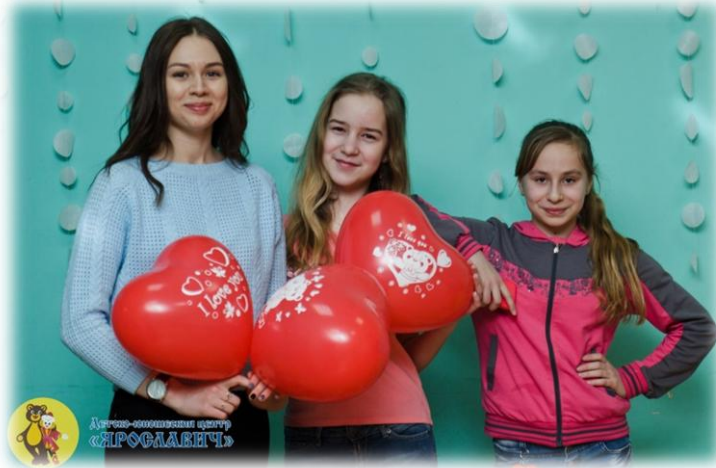
Хореографическая студия «Фантазия»