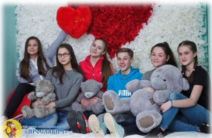
Вокальная студия «Каприз»