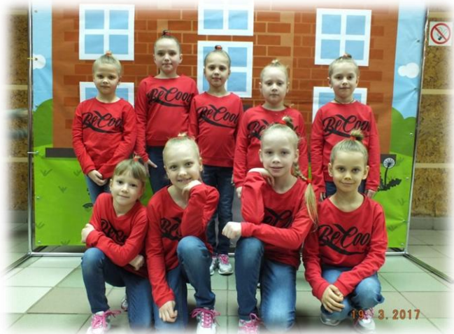
Студия современного танца «76 регион»