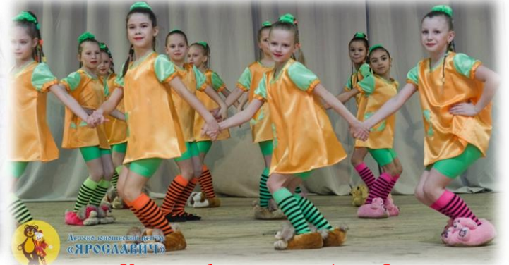
Хореографическая студия «Фантазия»