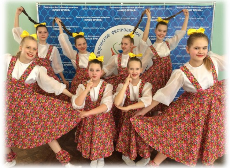
Хореографический ансамбль «Ритм»