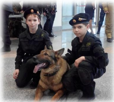
Клуб КУДО «Ярославич»