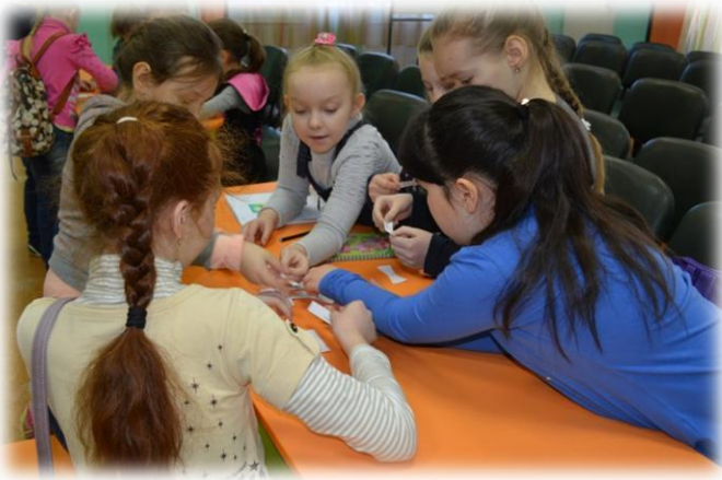
Досуговая площадка на Труфанова